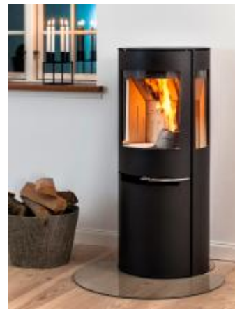
Aduro H1 kan fyres med både pellets og ved, og har fått miljøpris av EU. B 50 x d 50,8 x h 120 cm, fra ca. 43 000, aduro.no .

– Før energikrisen har vi antatt at man ofte øker verdien på boligen med 50 000–100 000 kroner ved å installere en fin peis. I lys av energikrisen er det foreløpig vanskelig å anslå noe sikkert, men vi ➤