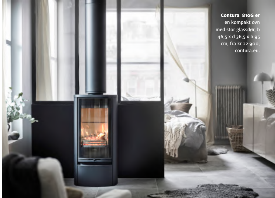
Contura 810G er en kompakt øvn med stor glassdør, b 46,5 x d 36,5 x h 95 cm, fra kr 22 900, contura.eu .

D et har alltid vært interesse for boliger med flere varmekilder, men de siste årene har vi sett et økt fokus på mer energieffektive og miljøvennlige alternativer. Interessen har naturlig nok eskalert under strømkrisen. Folk er mer opptatt av alternative oppvarmingskilder, sier Carl O. Geving, administrerende direktør i Norges Eiendomsmeglerforbund.